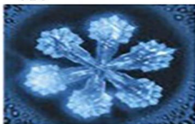
«СВЯТАЯ» ВОДА ИЗ ХРИСТИАНСКОЙ ЦЕРКВИ