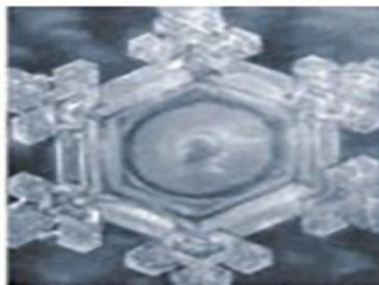
Вода, которой говорили «БЛАГОДАРИЮ ТЕБЯ!»