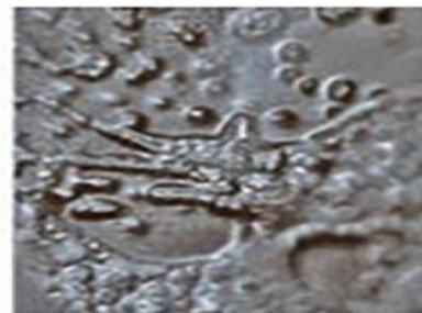
Вода, которой говорили «НЕНАВИЖУ ТЕБЯ!»