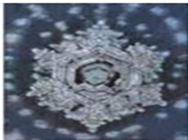
Вода, которой пели буддийские молитвы

ФОТО СТРУКТУРЫ ВОДЫ, СДЕЛАННЫЕ ЯПОНСКИМ ПРОФЕССОРОМ-ИССЛЕДОВАТЕЛЕМ МАСАРУ ЭМОТО ПРИ ВОЗДЕЙСТВИИ НА ВОДУ СЛОВОМ, ЧУВСТВОМ, МЫСЛЮ.