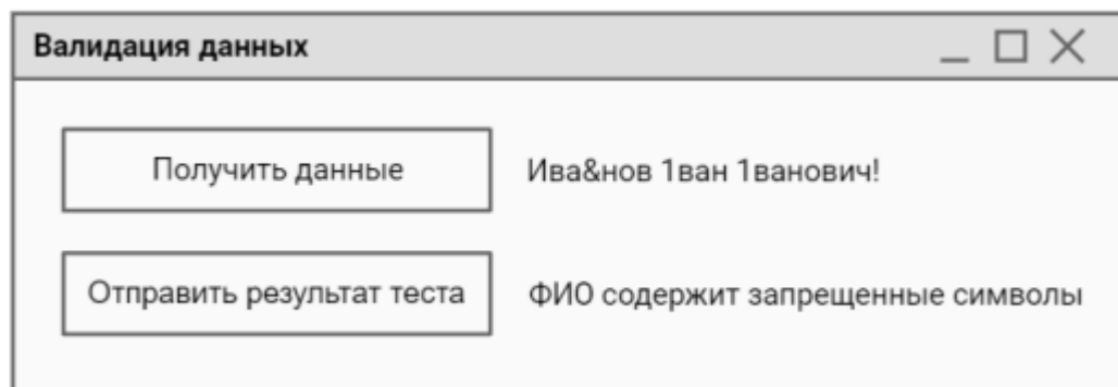
Рисунок - Макет окна приложения валидации данных

Сначала заполните в документе ТестКейс.docx столбец «Действие» и «Ожидаемый результат» используя предоставленный текстовый редактор. Добавьте закладки в столбец «Результат». Необходимо провести валидацию ФИО клиента на вхождение запрещенных символов. Проверьте два любых критерия. Для эмуляции отправки данных от клиента Вам необходимо запустить приложение TransferSimulator.exe. Методы эмулятора описаны в файле api_info.pdf. Макет формы представлен на рисунке.